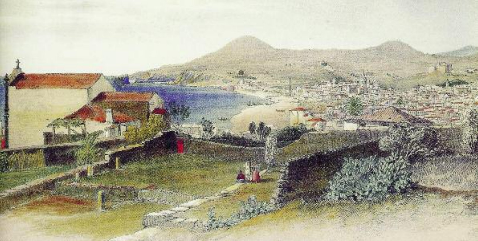
Vista sobre o Funchal – gravura antiga