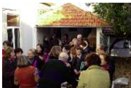
Museu Colecção Berardo (Pintura de Jorg Immendorf - Anbetung des Inhalts - 1985) Museu da Ciência Magusto de S. Martinho