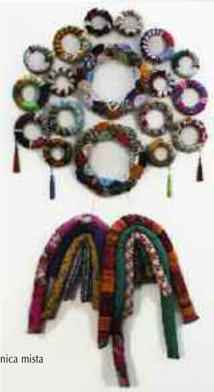
Título: Pão de bodo Ano: 2010 Técnica: Tecidos com técnica mista Dimensões: 164x85x10cm