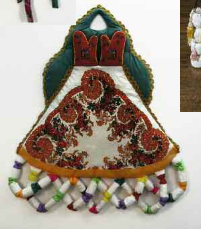
Título: A Promessa Ano: 2010 Técnica: Tecidos e galão Dimensões: 135 x 115 x 10cm