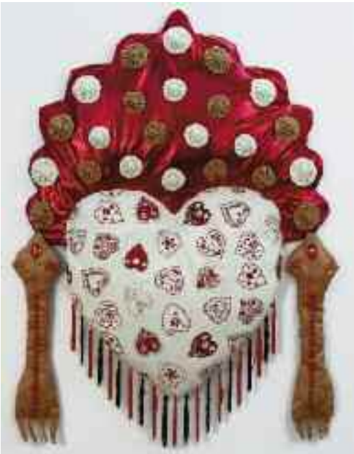
Título: Fazer do brinco coração Ano: 2010 Técnica: Tecidos fuxicos com técnica mista Dimensões: 110 x 80 x 10 cm

Uma visão contemporânea das tradições culturais açorianas