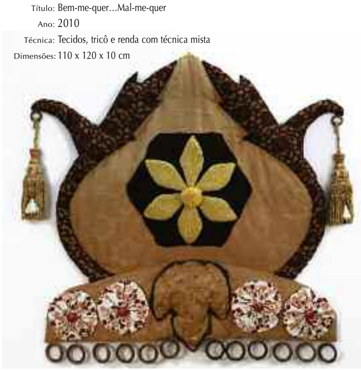
Título: Bem-me-quer...Mal-me-quer Ano: 2010 Técnica: Tecidos, tricô e renda com técnica mista Dimensões: 110 x 120 x 10 cm