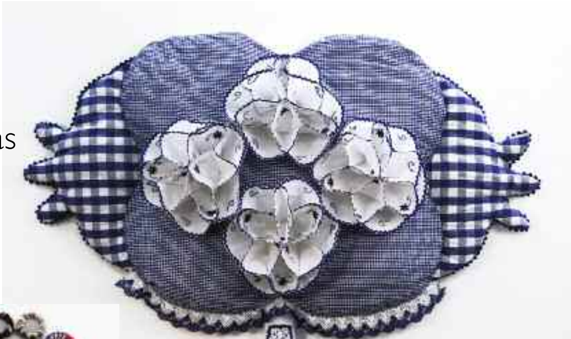
1ª 5EDF2BO4 Título: A Biscoiteira Ano: 2010 Técnica: Tecido, grega e tela plástica Dimensões: 130 x 130 x 10 cm